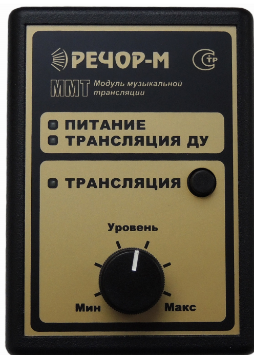
Рис. 1 Общий вид модуля ММТ

Для установки номинального уровня симметричного сигнала на выходе модуля может быть использован встроенный регулятор УРОВЕНЬ.